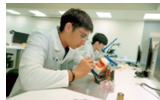
1人1機際操作，強化實作

培育牙科各式義齒及矯正裝置製造人才，結合口腔醫學專業，養成數位與傳統義齒製造技能。擁有國內與國外實習機會，同時培養專業技術及國際素養。牙體技術師證照高考及格率為全國技專院校之冠，可任職於牙體技術所與各大醫療院所，或從事牙科材料與設備銷售；更可自行創業開設牙體技術所，亦可直接晉升研究所，就業與升學發展多元。