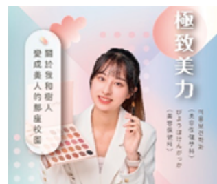
專業彩妝造型設計

本校以醫護管理相關科系起家，本科之特色定位於「醫學美容與養生保健」；除了美容護膚、彩妝造型與化妝品專業技能外，搭配本校優質醫護專業教學資源，培育全方位美容保健之人才；且具有全新的教學設備及堅強的師資陣容。實習將前往醫學美容美體集團、化妝品專櫃、休閒運動健康管理等相關機構。