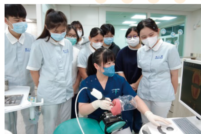
專業牙醫師進行口掃機教學

南部首創系科，提供完整臨床口腔衛生教育及全國唯一含跨醫學影像、牙體技術領域；並結合長期照護、咀嚼吞嚥障礙的「口腔照護學程」。在學期間參加學海與展翅計畫，除能到海外見、實習外，而且五年免學費及畢業前就有工作。本科畢業生可取得「操作人員輻射安全證書」、「特殊需求者口腔照護指導員」證照，立法通過後可取得口腔衛生師/士資格。