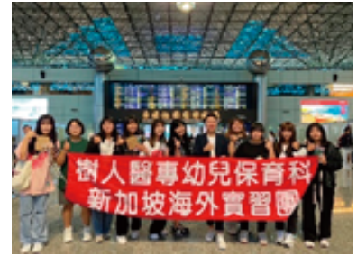
幼保科至新加坡幼兒園有新實習

具備專業師資與完善設備，國家級多元證照輔導融入課程規劃，涵蓋托育人員、幼兒體能、烘焙、電腦軟體應用、TQC等；本科與國內外知名教保機構產學合作共進行有新實習，拓展學生國際視野，培育優秀教保人才。就業領域跨足國內外幼兒園、托嬰中心等兒童產業，並可至海外擔任華語幼教師，畢業即就業。