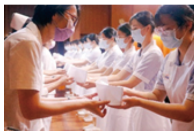
為學生打造專屬的護理舞臺

師資設備完善，教學認真好口碑，提供英日語學習及國際交流資源，培養出具國際觀的優秀護理師。完整的職涯輔導，從醫院參訪、職涯講座、展翅計畫、專業實習/臨床就業選習、就業博覽會/就業媒合、免費且精實的考照衝刺課程等，一路陪著學生成長、蛻變，到順利考上護理師證照、進入職場，讓學生畢業即就業，見證護理的無限可能。