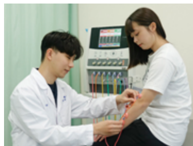
物理治療之電療儀器

積極輔導考取物理治療師證照，考照率皆高於全國平均值，於106、107及109年考出「全國榜首」的好成績。課程設計以實務為導向，佐以完善的儀器設備，提供學生以物理治療為核心，輔以長期照護與輔具及運動體適能之多元學習，提高學生就業及發展的競爭力。與各大醫療機