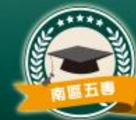
113學年度全國五專聯合免試入學 報名繳費金額檢核表