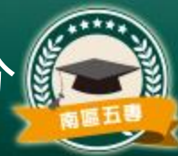
超額比序項目積分